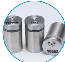
金属などの素材に