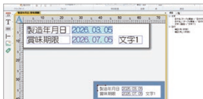
DiPO Partner 画面

印刷する文字や日付、イラストなど、印刷内容を作成・編集することができます。作成・編集したデータは USB メモリまたは Bluetooth® 通信で DiPO 本体に保存することができます。