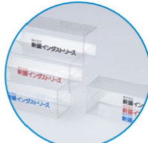
透明なプラスチック素材に