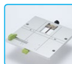
ガイド付ステージ※6