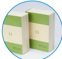
組立済のパッケージに