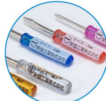
凸凹のあるものに