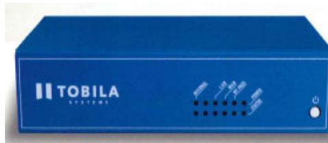
光回線用 TRS-1010A ※特許取得技術